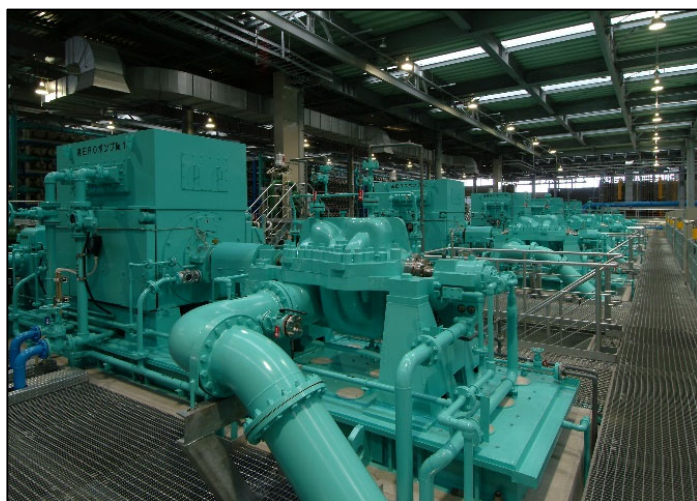
海水淡水化センター 高圧ROポンプ設備