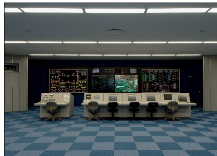
海水淡水化センター 中央監視設備